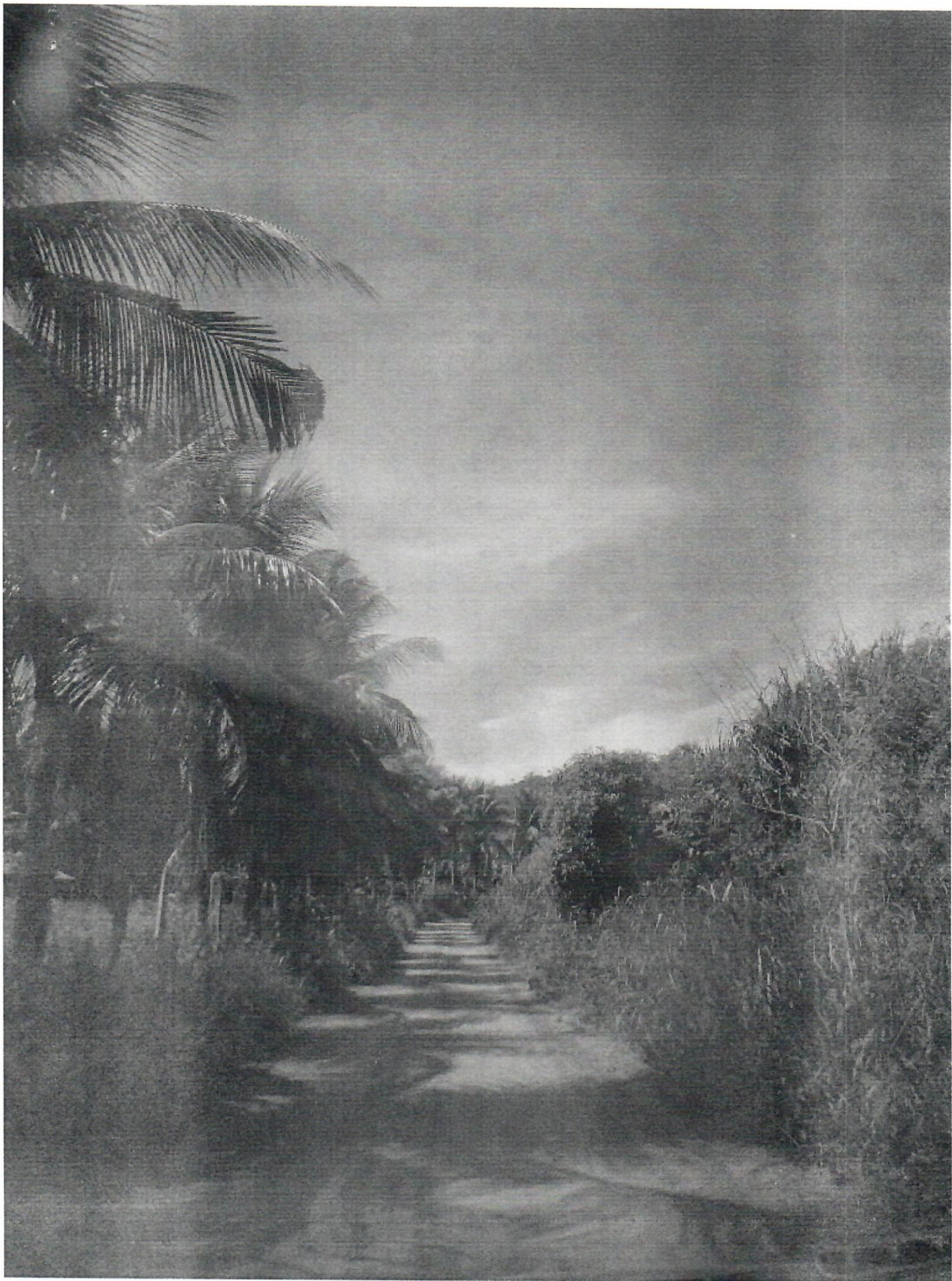
Córrego da Riaba